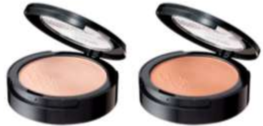
01 クールアイボリー 明るい肌色